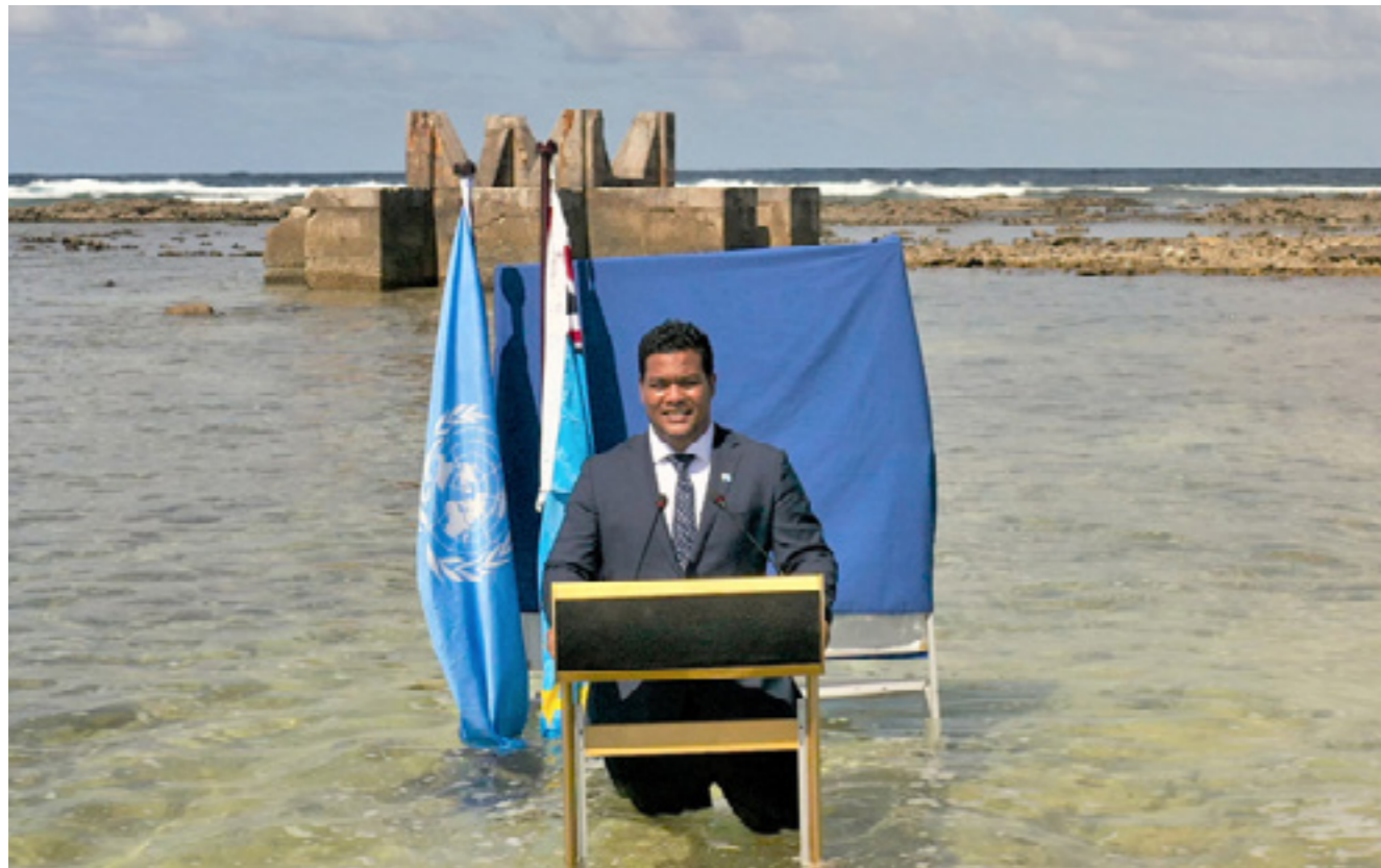
El ministro de AAEE de Tuvalu, Simon Kofe, dio un discurso durante la COP 26 en el mar para denunciar la crisis climática.

Directora ejecutiva de la revista Lancet Countdown .